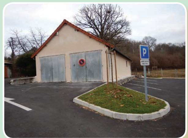
Après travaux (manque le remplacement des portes)