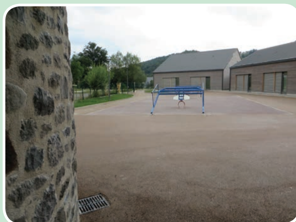
Après (enrobé couleur)