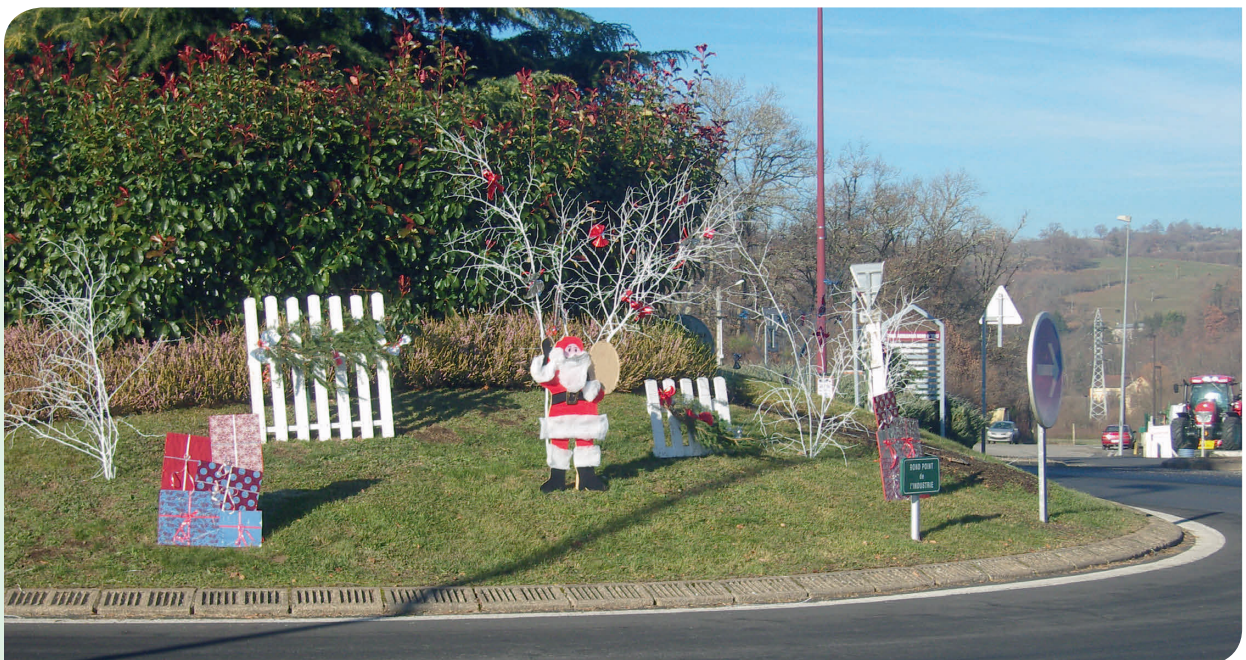
Le Rond-Point de la République décoré par les enfants...

Rendez-vous est pris pour l'année prochaine avec, on l'espère, plus de bénévoles encore, qui pourront nous faire partager leur talent et proposer de nouvelles idées.