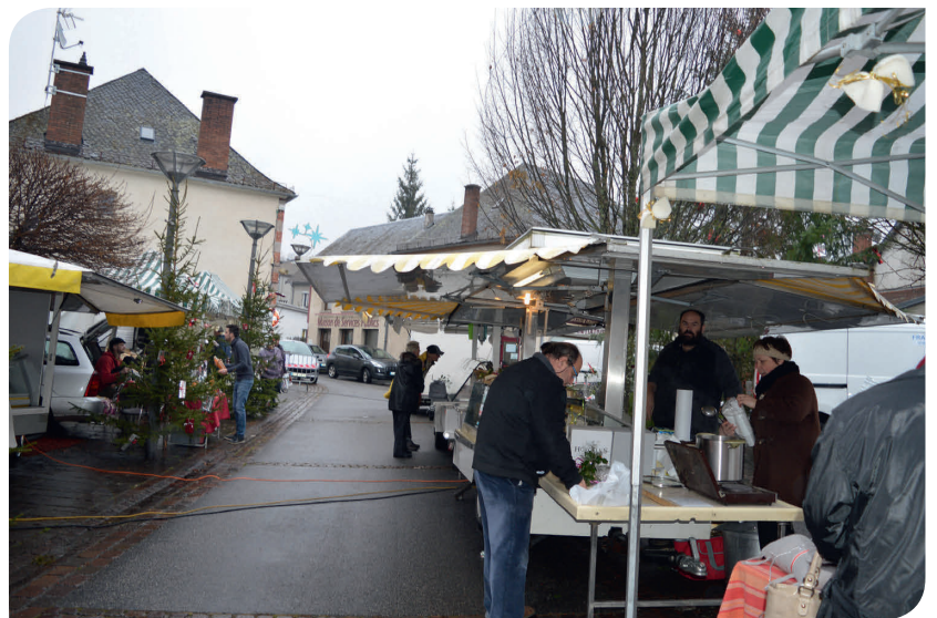
Marché de Noël.

Jeudi 15 décembre 2016 Visite du Père Noël à la Mairie pour les enfants du Personnel.